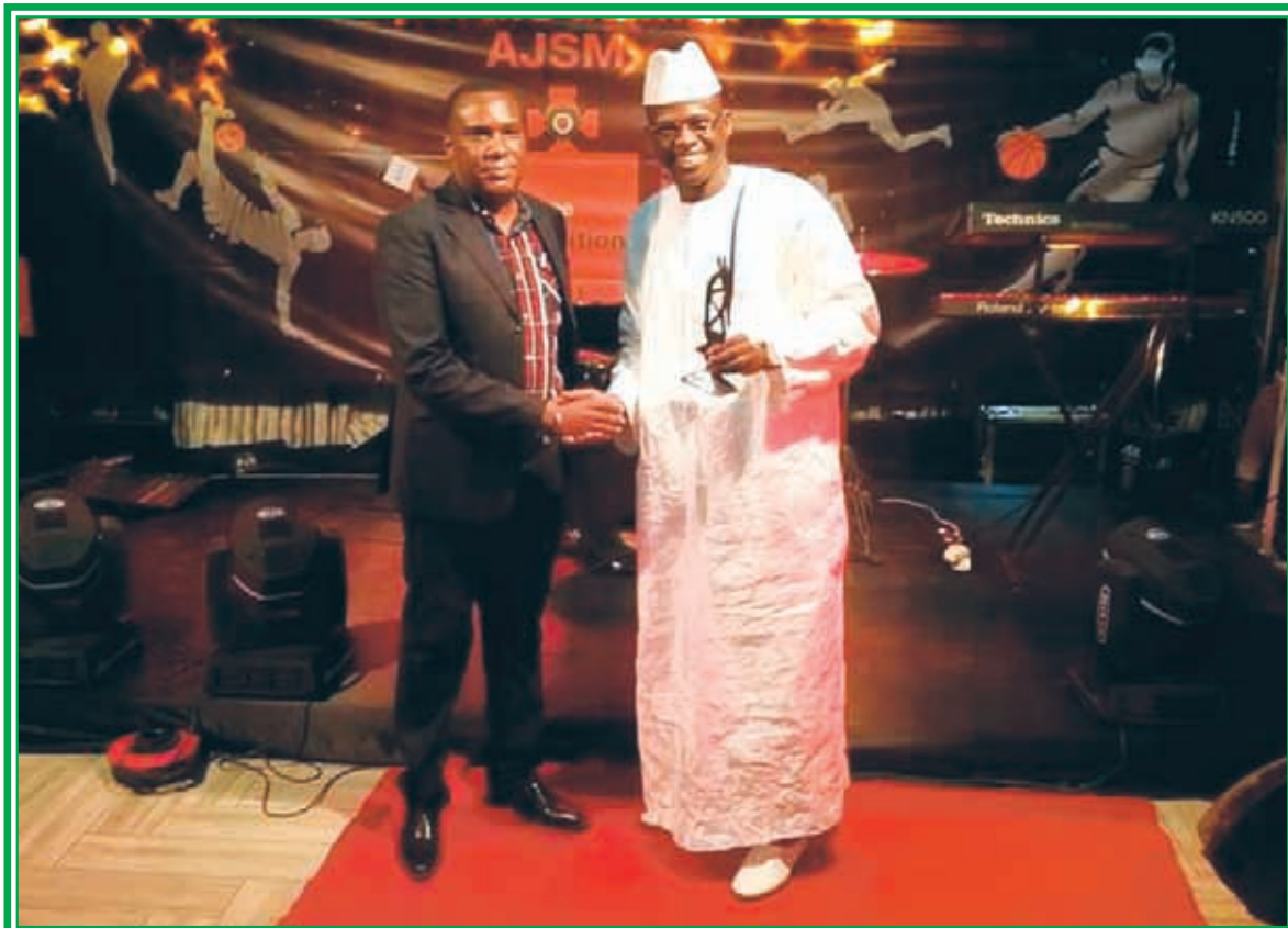
Remise de distinction au PDG de la BNA par l'Association des Journalistes Sportifs du Mali, 30 décembre 2016