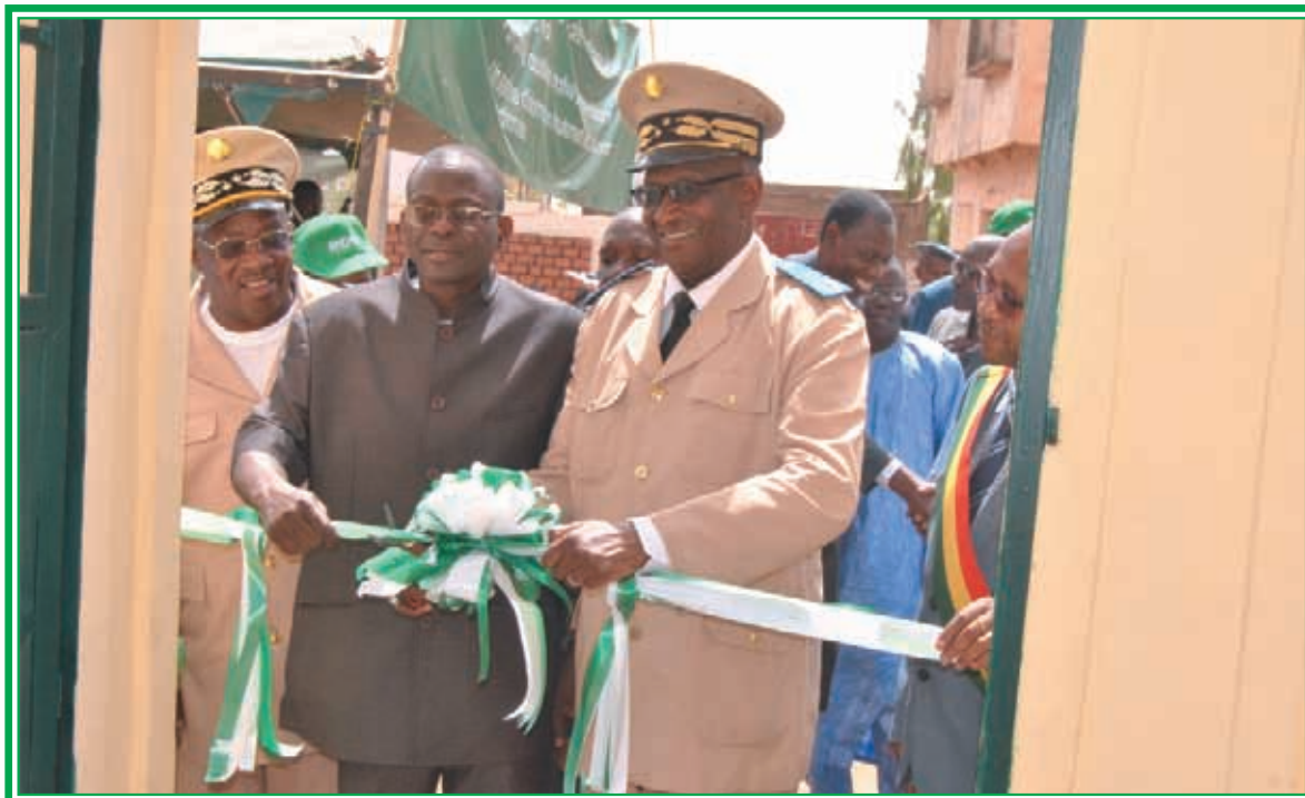
Cérémonie d'inauguration officielle de l'Agence BNA de Koulikoro, 23 mars 2017