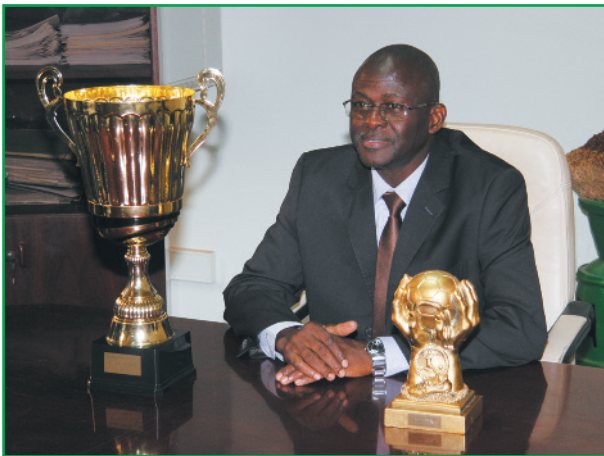
Présentation des Trophées de la Coupe APBEF au PDG de la Bnda M. Moussa Alassane DIALLO