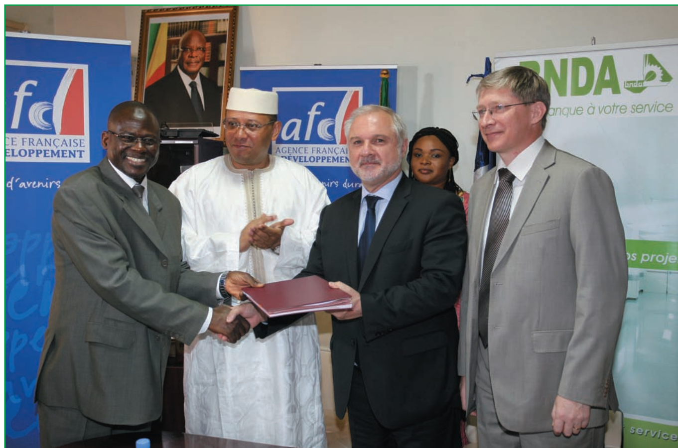
Signature convention de subvention entre l'AFD et la BNDA, le 17 Novembre 2015 au siège de la BNDA

Les modifications du capital social (augmentation, réduction) qui auraient pour effet le franchissement de certains seuils fixés par la loi bancaire doivent être soumises à autorisation préalable du Ministre des Finances, après avis conforme de la Commission Bancaire.