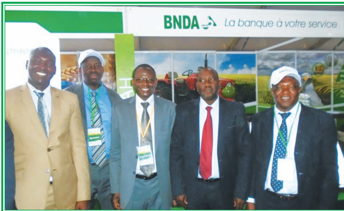
Le PDG et des Cadres de la BND A devant leur Stand au SIAGRI 2016