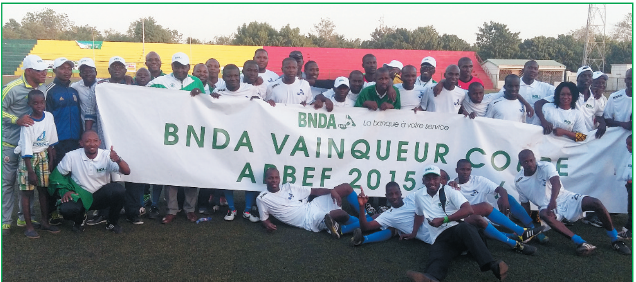
L'équipe de la Bnda célèbre son sacre