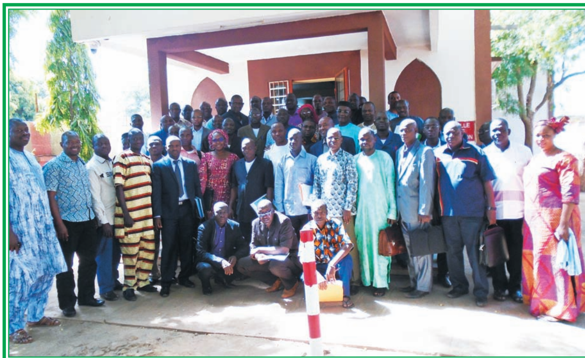
Regroupement Commercial et Session Budgetaire 2016 - Ségou Novembre 2015