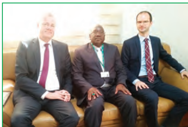
L'Ambassadeur de la République Fédérale d'Allemagne au Mali, son Excellence Dietrich BECKER (à gauche) en visite à la BNDa - 30 avril 2018